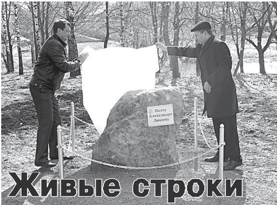
Наш земляк, поэт Александр Иванович Люкин родился 29 марта 1919 года в Княгининском крае в селе Шковерка (Шишковердь).

Вечера, посвященные А. И. Люкину, ежегодно проводятся в центральной библиотеке Княгининского района, носящей его имя. В этом году юбилейный вечер, посвященный 95-летию со дня рождения поэта, проходил в кинозале ФОКа «Молодежный». Он прошел под эпитафией «Живые строки Люкина». Перед началом праздничного вечера в сквере Люкина, так теперь официально называется парк около банного озера, был заложен памятный ка-